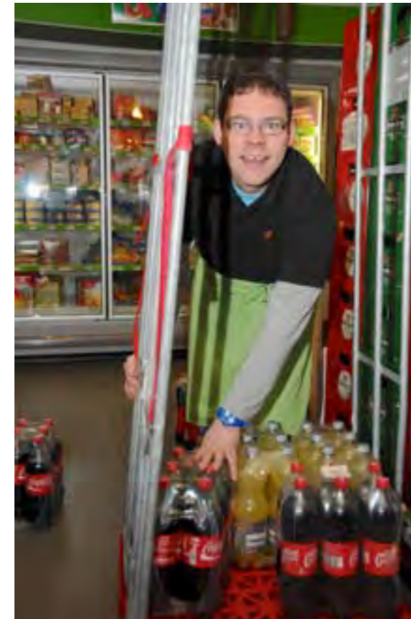
‘Er werd echt goed geluisterd en er waren ook mensen die dingen opschreven’